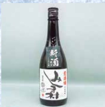
焼酎みしま村 荒濾過 (720ml・25%・2,530円)