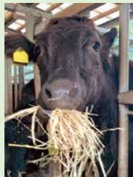
黄色のタグは耳標と言います

三島村で暮らしているお母さん牛は、広い場所でストレスなく暮らしているので足腰が強く、安産で元気な子牛を生みます。子牛は生まれてからお母さん牛と一緒に過ごし、骨太で締まった体つきに育ちます。島を出ても、このしっかりとした骨が体の成長を支え、立派な肉牛に育つのです。また、三島村の牛は、人があげるエサのほかに、島に生えている琉球竹の葉っぱや柔らかい茎、たけのこなども食べるので、低コストで育っています。皆さんが食べる牛肉も、ひょっとしたら三島村生まれかもしれませんね。