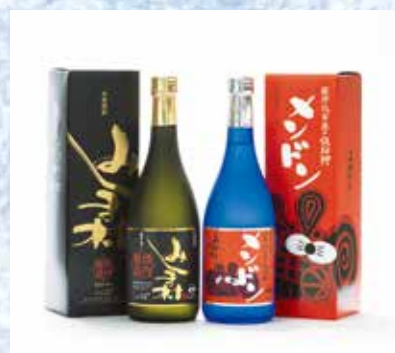
焼酎みしま村・メンドン (各720ml・25%・3,600円)