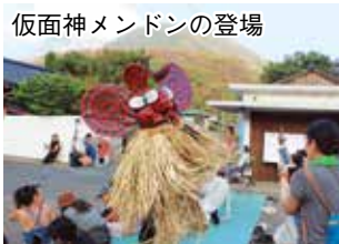
仮面神メンドンの登場

旧暦8月1・2日に行われる硫黄島八朔太鼓踊りが、今年は9月3、4日に実施されました。 硫黄島区長から「この伝統行事に職員も参加して経験して欲しい」とお誘いもいただき地域担当職員が参加しました。 硫黄島地域担当職員は活動の柱として「伝統芸能の保存活動」を掲げています。昨年は諸事情により全員での参加ができませんでしたが、今年は4人で参加させていただきました。 映像、写真による保存活動、着付けの補助など初めて参加する職員もあり、準備段階から硫黄島地区の皆様からの助けをいただきながら活動しました。