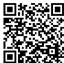
鹿児島県ホームページ

県のホームページでは、避難施設の一覧を掲載しているほか、国の国民保護ポータルサイトとリンクして、利用者が現在地付近の避難施設情報を簡易な操作で確認できるようにしております。