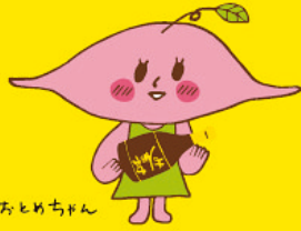
べにおとめちゃん