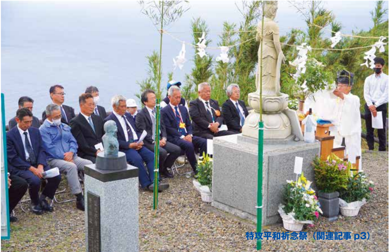
特攻平和祈念祭 (関連記事 p3)