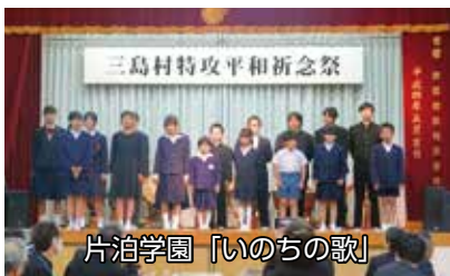
片泊学園「いのちの歌」

黒島平和公園で行われた慰霊祭。地区代表のあいさつや黙とう、野いちご奉納などを通じ、平和への想いを新たにしました。