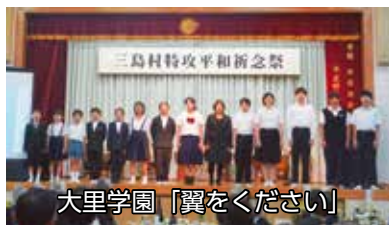
大里学園「翼をください」

大里婦人会の皆様が準備して下さった三島村ならではの食事をいただきながら、平和について考える時間となりました。