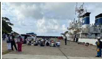
【離島防災訓練 (硫黄島)】