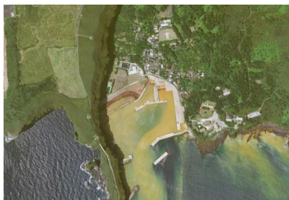
【三島硫黄島学園校区】