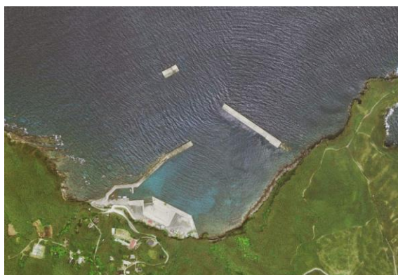
【三島竹島学園校区】

かんさつしたことをもとに、学校のまわりの絵地図を作りましょう。教科書や地図ちょうなどもさんこうにしましょう。