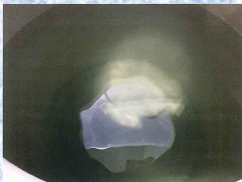
精製後のキレイな原酒