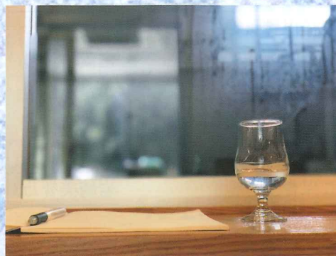
テイスティング時の様子