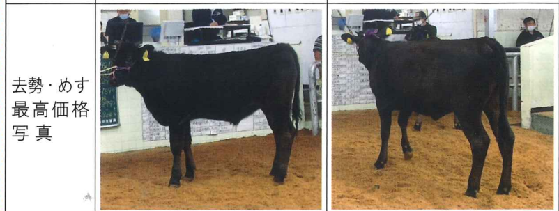
去勢・めす 最高価格 写真