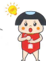
ねんきん太郎 「ねんきんネット」マスコット