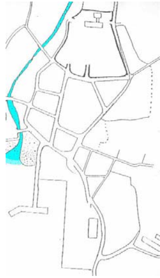
三島小中学校校区