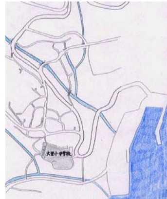
大里小中学校校区