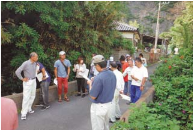
硫黄島地区でのワークショップ（10月20日）