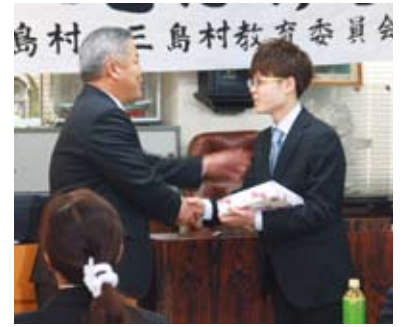
村長から記念品贈呈

その後壇上で一人ひとり自己紹介と決意表明し、社会人として、それぞれの道で頑張っていくことを約束しました。 三島村から単立ち、今大きく羽ばたこうとしている新成人。皆さんのこれからの活躍に期待します。