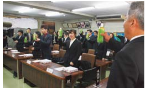
新成人の門出を祝い乾杯！