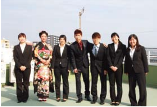
参加した7名の新成人