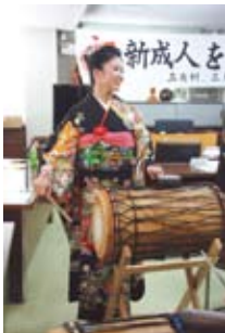
新成人を交えてのジャンベ演奏「ジョレ」