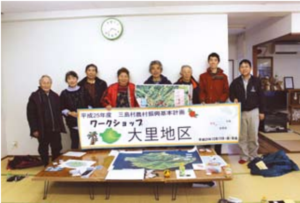
大里地区でのワークショップ（12月13日）

昨年10月から順次、各地区で集落点検ワークショップを開催し、住民から多くの意見や要望を頂くことが出来ました。今後、さらに、アンケートや島の調査、地区会の役員さん方との協議を進め、目標年度や地域住民との役割分担などを明確化し、より具体的な実施方針を定める予定です。